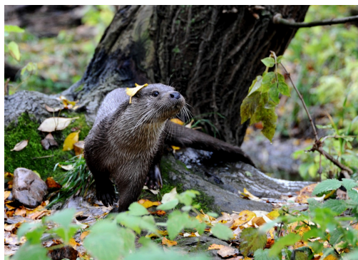
Mâle Loutre