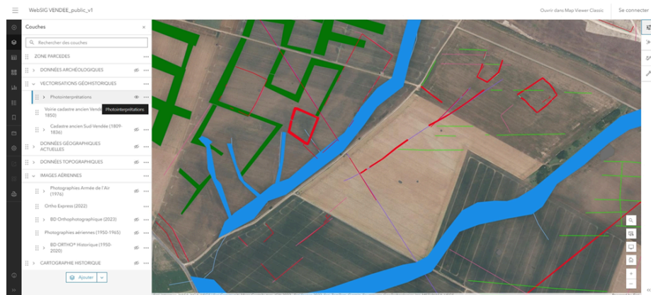
WebSIGVENDEE – Photo interprétation – Géoportail PARCEDES

Cela permet de faire émerger un nouvel objet d'histoire agraire et paysager : la dynamique et la résilience des formes parcellaires dans l'espace-temps des sociétés.