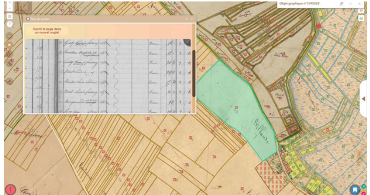
Plan et état de section du cadastre napoléonien

( https://archives.vendee.fr/participer/reconstituez-les-paysages ).